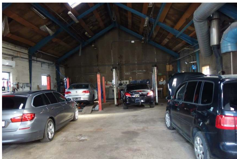
Det ene værksted