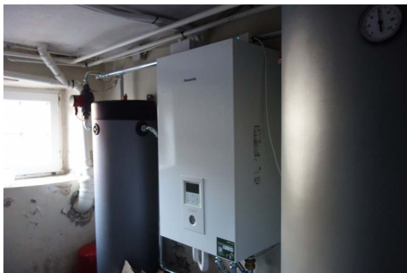
Luft til Vand