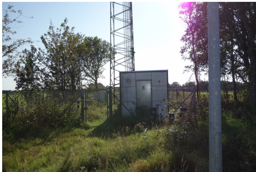
Antennemast og Kabine