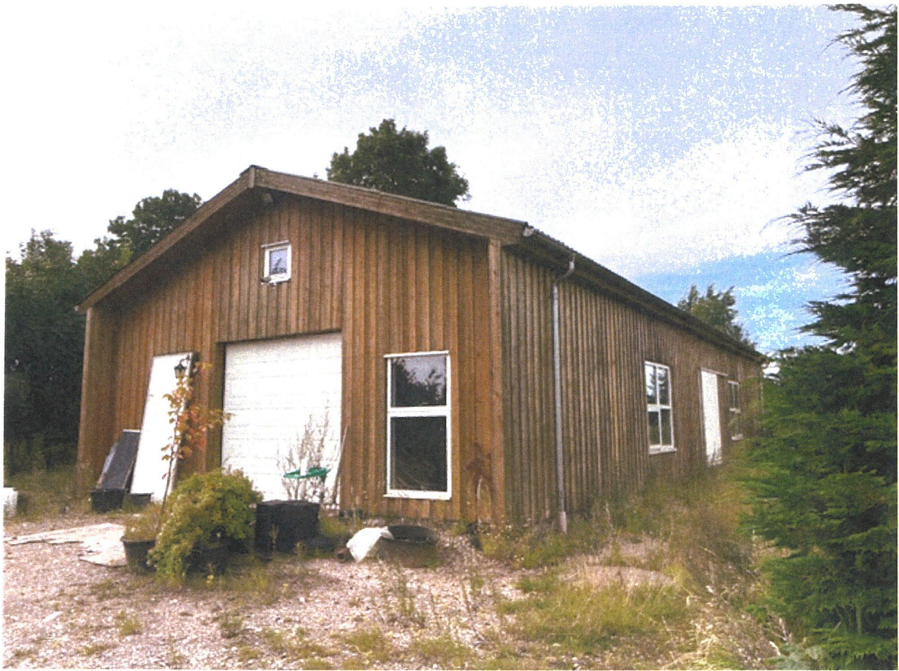
Sendt fra min iPhone